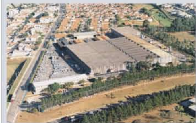
Vista aérea da fábrica em Jundiaí - SP

Com mais de 125 anos de experiência no setor metalúrgico a Maccaferri fabrica, de acordo com as mais avançadas tecnologias, arames e alambrados zincados e plastificados de altíssima qualidade para durar no tempo, mesmo nas mais severas condições de utilização.